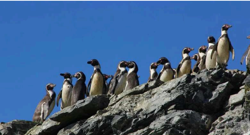
RESERVA PINGÜINO DE HUMBOLDT

Las Palmeras está ubicada en una de las zonas con mayor atractivo turístico del norte de Chile. Reciben miles de visitantes cada año por su entorno único y su belleza natural.