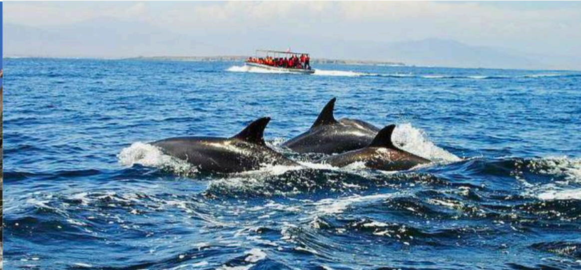
AVISTAMIENTO DE DELFINES Y BALLENAS