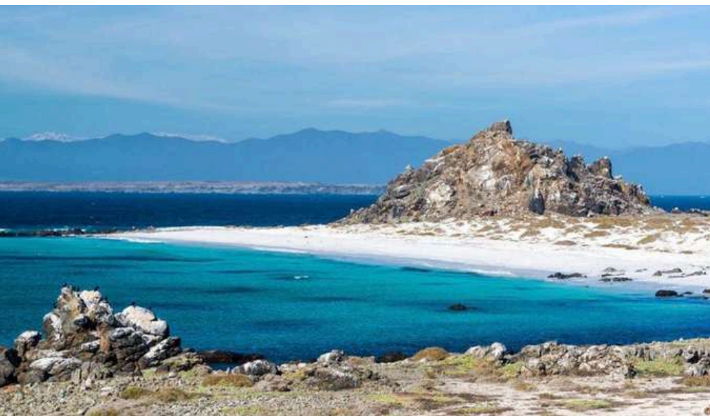
PLAYA LOS NÁUFRAGOS